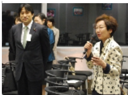
(川口順子元外務大臣と川田龍平参議院議員)