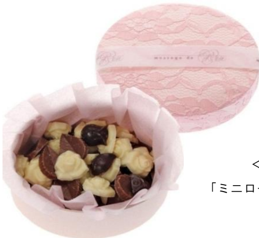
＜メッセージュ・ド・ローズ＞ 「ミニローズ」1,260 円 (TFT 価格 1,280 円)