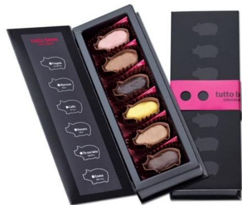
＜トゥット・ベーネ＞ 「タツツァ」 1,260 円 (TFT 価格 1,280 円)

TABLE FOR TWO は、世界の食の不均衡（先進国の生活習慣病改善と開発途上国の食料不足問題）を同時に解消するために考えられた仕組みで、先進国の社員食堂やレストラン等の利用者から寄付された募金を、開発途上国の学校給食に寄付する仕組みです。高島屋では 2011 年 9 月から社員食堂で TFT の活動に取り組んでおり、