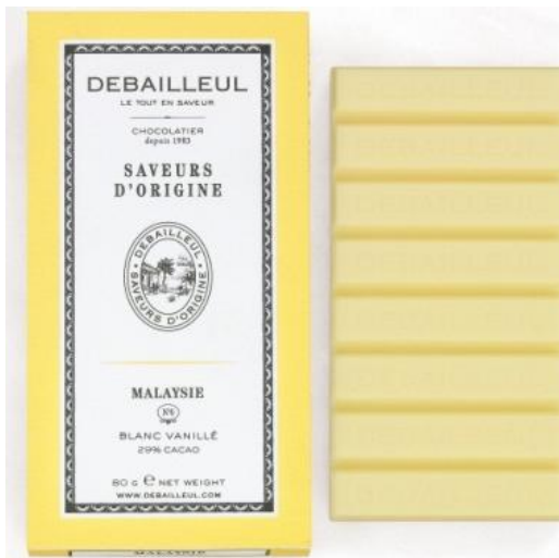
＜ドゥバイヨル＞ 「タブレット マレーシア ホワイト」 1,050 円 (TFT 価格 1,070 円)