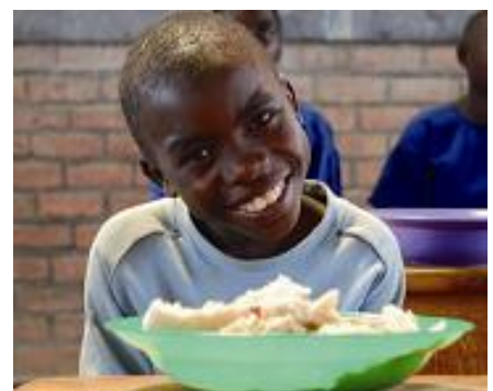
TABLE FOR TWO は、世界の食の不均衡（先進国の生活習慣病改善と開発途上国の食料不足問題）を同時に解消するために考えられた仕組みで、先進国の社員食堂やレストラン等の利用者から寄付された募金を、開発途上国の学校給食に寄付する仕組みです。高島屋では 2011 年 9 月から社員食堂で TFT の活動に取り組んでおり、