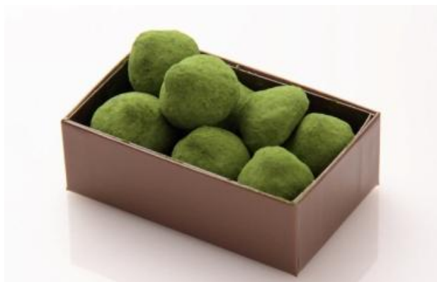
＜パティスリー・サダハル・アオキ・パリ＞