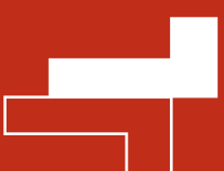
TABLE FOR TWO®